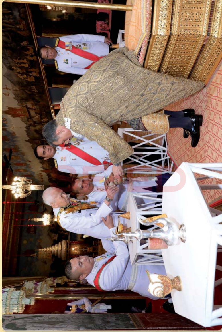
พลเอกเปรม ติณสูลานนท์ ประธานองคมนตรี ถวายรางวัลพระสุรชาติไทย ในพระราชพิธีบรมราชาภิเษก วันที่ ๔ พฤษภาคม ๒๕๖๒