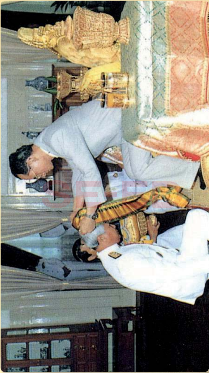
พระบาทสมเด็จพระปรมินทรมหาภูมิพลอดุลยเดช มีพระบรมราชโองการโปรดเกล้าฯ ให้ พลเอกเปรม ติณสูลานนท์ เป็นองคมนตรี วันที่ ๒๓ สิงหาคม ๒๕๓๑