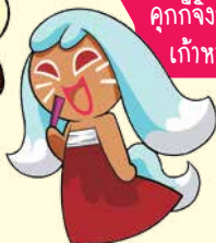
คุกกี้จิ้งจอก เก้าหาง