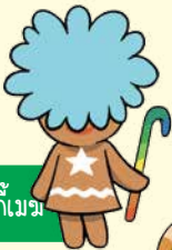
คุกกี้ เมฆ