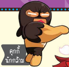
คุกกี้ นักกล้ำ