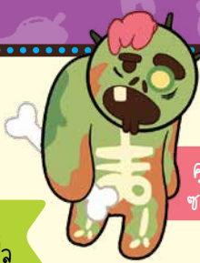
คุกกี้ ซอมบี้