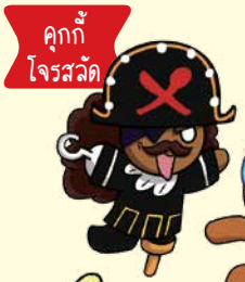
คุกกี้ โจรสลัด