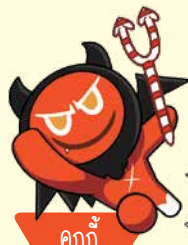
คุกกี้ เดวิล