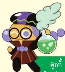
คุกกี้ นักแปรธาตุ