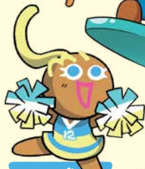
คุกกี้ เชียร์ลีดเดอร์