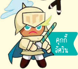
คุกกี้ อัศวิน