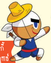
คุกกี้ จอมยุทธ์