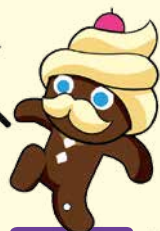
คุกกี้ช็อกโก ครีมเนย