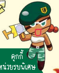
คุกกี้ หน่วยรบพิเศษ