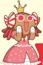
คุกกี้ เจ้าหญิง