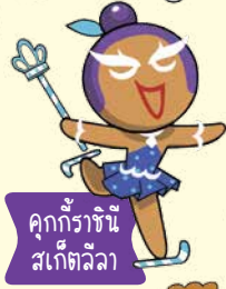
คุกกี้ราชินี สเก็ตลีลา