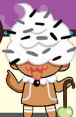
คุกกี้รส คุกกี้แอนด์ครีม