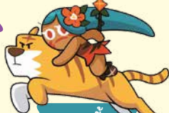
คุกกี้ สาวเจ้าป่า