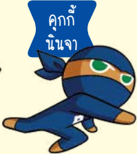
คุกกี้ นินจา