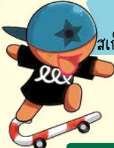
คุกกี้ สเก็ตบอร์ด