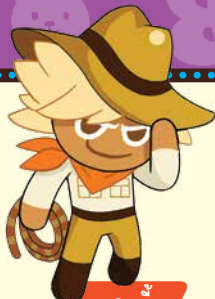
คุกกี้ นักสำรวจ