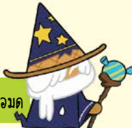
คุกกี้ น่อมด