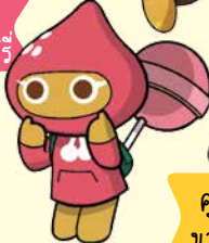
คุกกี้ นางฟ้า