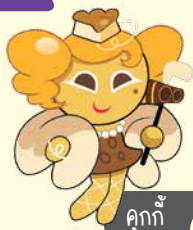
คุกกี้ รสชีสเค้ก