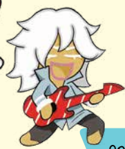
คุกกี้ ร็อกสตาร์