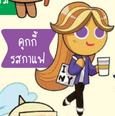
คุกกี้ รสกาแฟ