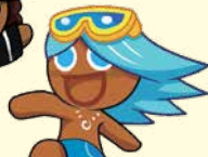
คุกกี้รส โซดา