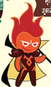
คุกกี้ ภูตอสูร