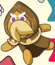
คุกกี้ นักนยากรณ์