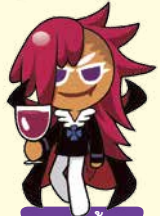
คุกกี้ แวมไพร์