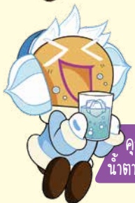
คุกกี้ น้ำตาลหิมะ