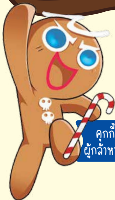
คุกกี้ ผู้กล้าหาญ