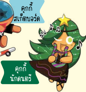
คุกกี้ นักดนตรี