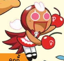
คุกกี้ รสเชอร์รี่