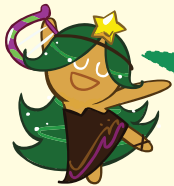
คุกกี้ นักดนตรี