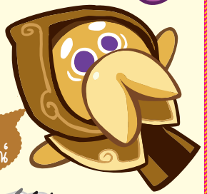
คุกกี้ นักขารณ