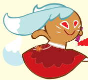
คุกกี้ จิ้งจอกเก้าหาง