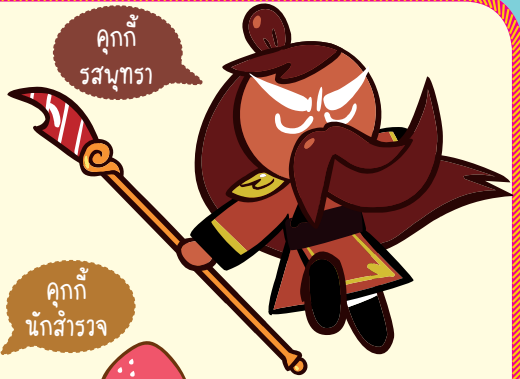
คุกกี้รสพารา