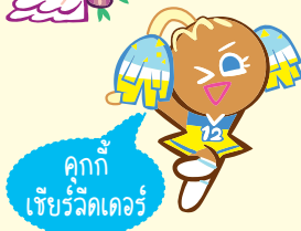
คุกกี้เชอร์รี่เดอรั