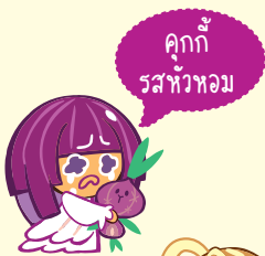
คุกกี้รสพวอม