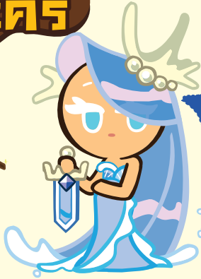
คุกกี้ นางฟ้าทะเล