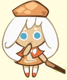
คุกกี้ รสช็อคครีม