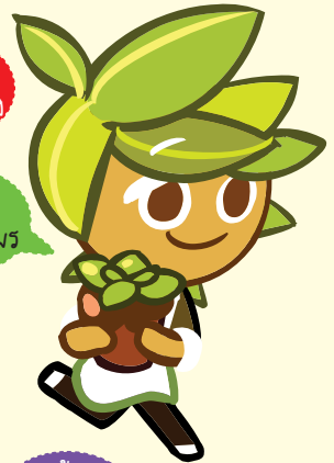
คุกกี้ รสสมุนไพร