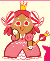
คุกกี้เจ้าหญิง