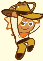
คุกกี้นักสำรวจ