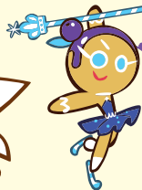
คุกกี้ราชินี สเก็ตลีลา