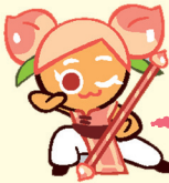
คุกกี้รสเนย