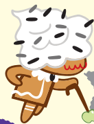
คุกกี้รสคุกกี้แอนด์ครีม