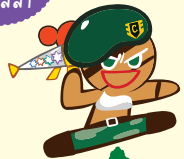
คุกกี้ หน่วยรบพิเศษ