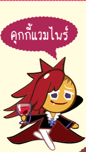
คุกกี้แวมไพร์