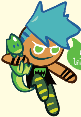
คุกกี้ ไดโนเสาร์