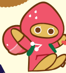
คุกกี้รสสตรอเบอร์รี่