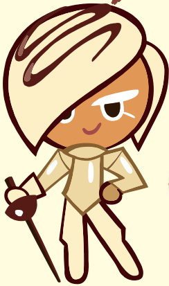
คุกกี้นุ่มด