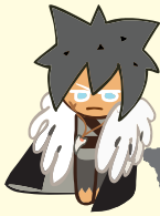
คุกกี้ หมาป่า