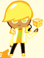
คุกกี้ รสเลมอน