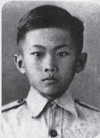
รูปถ่ายผมตอนเด็กๆ