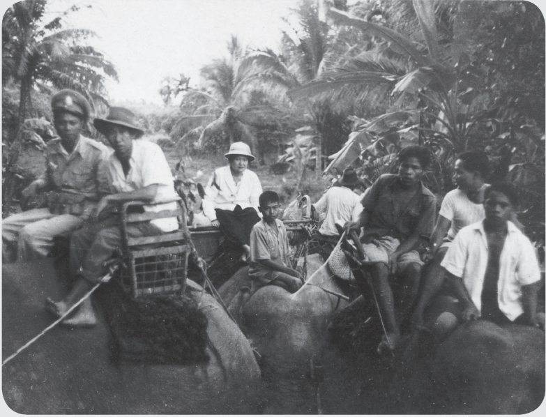
คุณแม่ขณะเดินทางไปเมืองแร่ โดยใช้ช้างเป็นพาหนะ (พ.ศ. 2491)