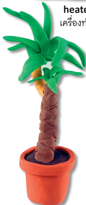
plant (พลาณฑ) ต้นไม้