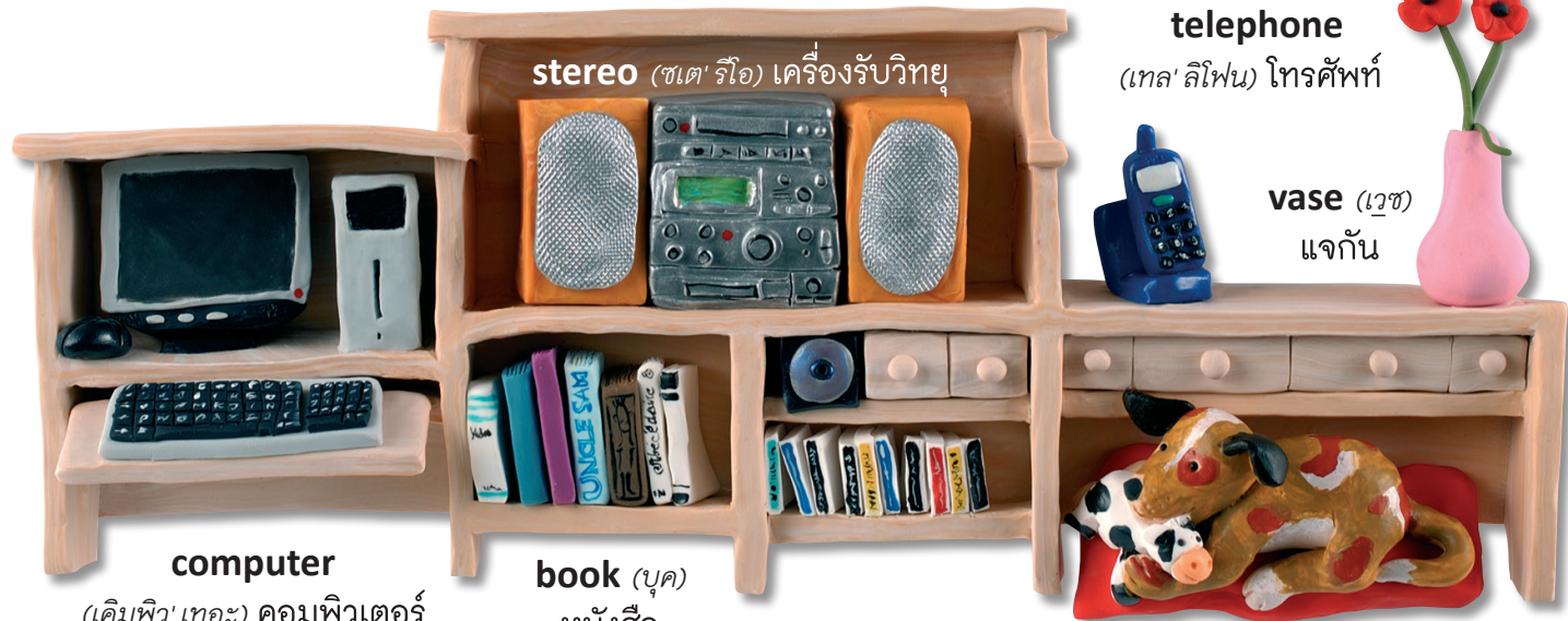
computer (เคอมพิว' เทอะ) คอมพิวเตอร์