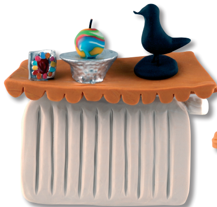
heater (ฮี'เทอะ) เครื่องทำความร้อน