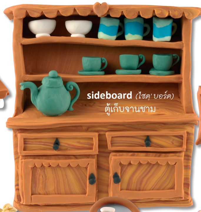
sideboard (ไซด์'บอร์ด) ตู้เก็บจานชาม

What makes the room warm? 🐟 อะไรทำให้ห้องอบอุ่น