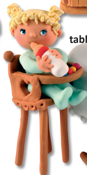
highchair (ไฮ'แชร์) เก้าอี้เด็ก