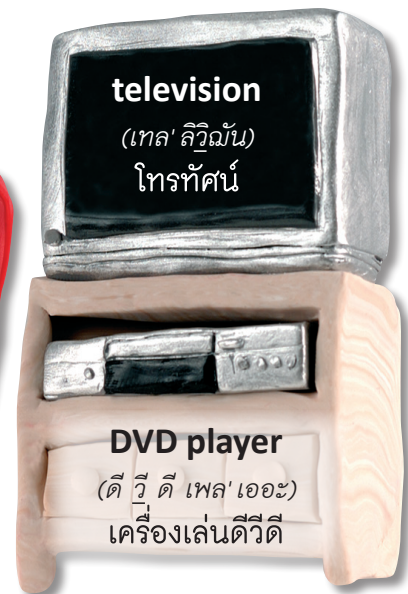
television (เทล' ลีวิชั่น) โทรทัศน์