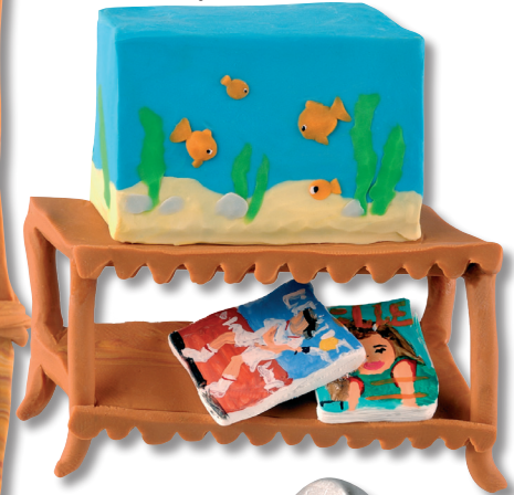
ตู้เลี้ยงปลา