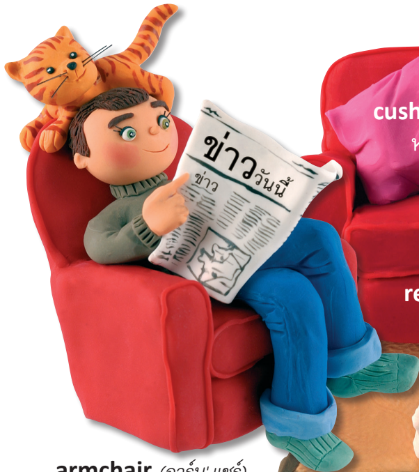
armchair (อาร์ม' แชร์) เก้าอี้นวม