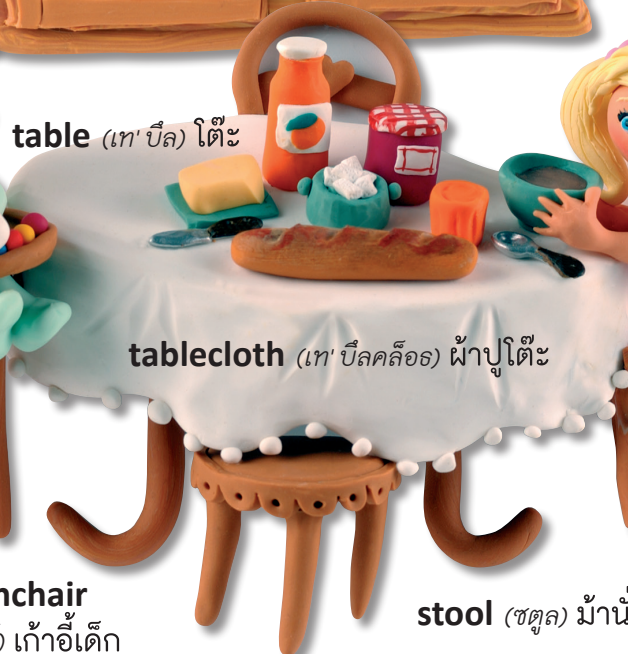
stool (ชตุล) ม้านั่ง