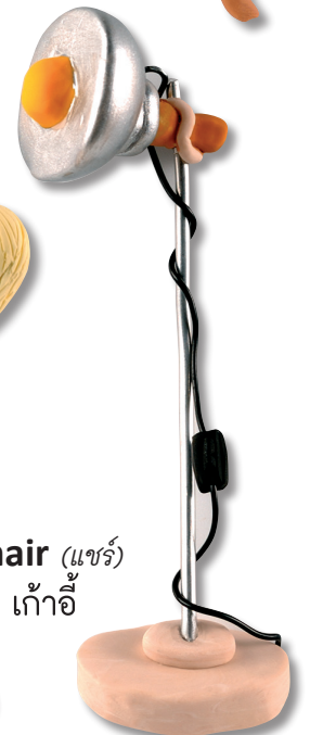
chair (แชร์) เก้าอี้