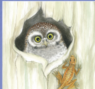
Pygmy owl นกเค้ากระระ