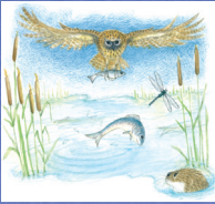
Pels owl นกทืดทือเพลส

นกเค้าแมวมีหลากหลายพันธุ์และขนาดตามภูมิประเทศและถิ่นกำเนิดทั่วโลก คนไทยมักเรียกนกตาโต ขนฟูสีน้ำตาล และหากินตอนกลางคืนว่า "นกฮูก" แต่ความจริง นกฮูกเป็นเพียงสายพันธุ์หนึ่งในตระกูล "นกเค้า" เท่านั้น เรามาดูกันเถอะว่า ในเล่มนี้มีนกเค้าพันธุ์อะไรบ้างนะ