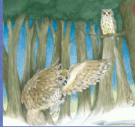
Eagle owl นกเค้าใหญ่