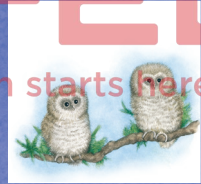
Spotted owl นกเค้าจุด