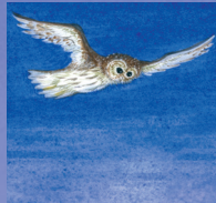
Rusty barred owl นกเค้าแมวลีคล้ำ