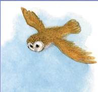
Barn owl นกแสก