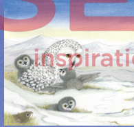
Snowy owl นกเค้าหิมะ